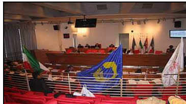
Palazzo della Provincia